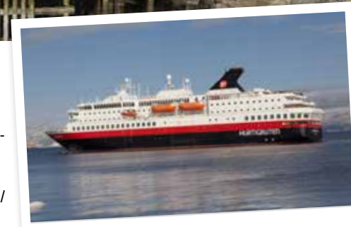
Die M/S Nordnorge