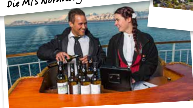
Unsere Bar an Bord