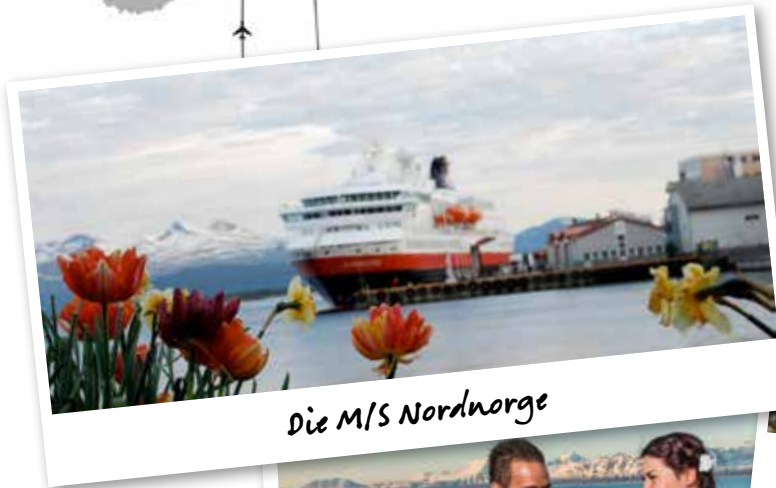
Die M/S Nordnorge