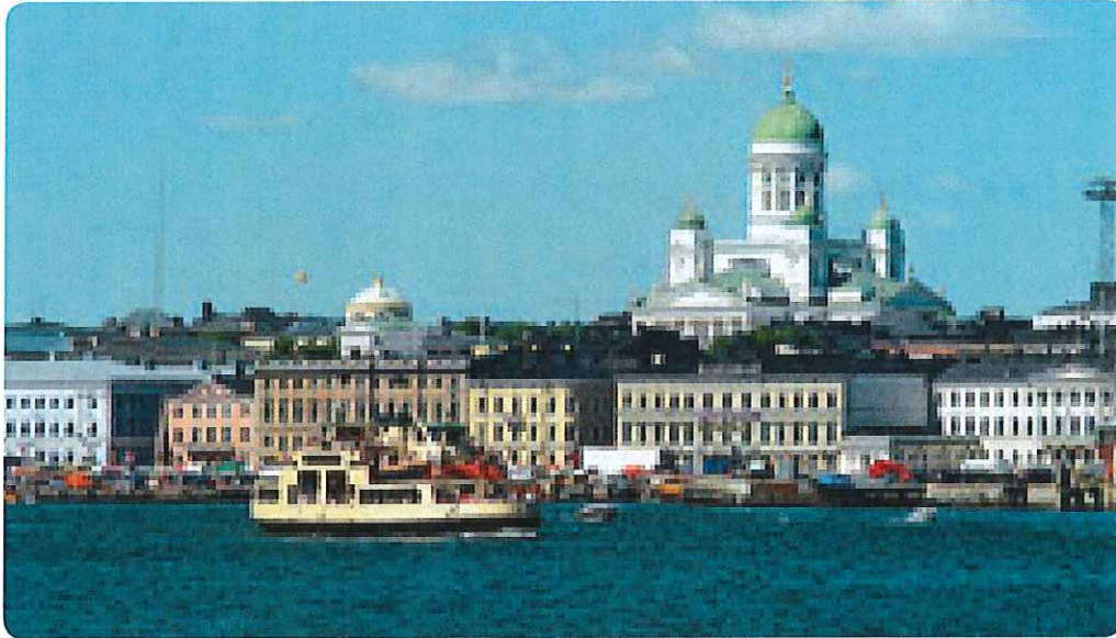
Blick auf die Designstadt Helsinki.