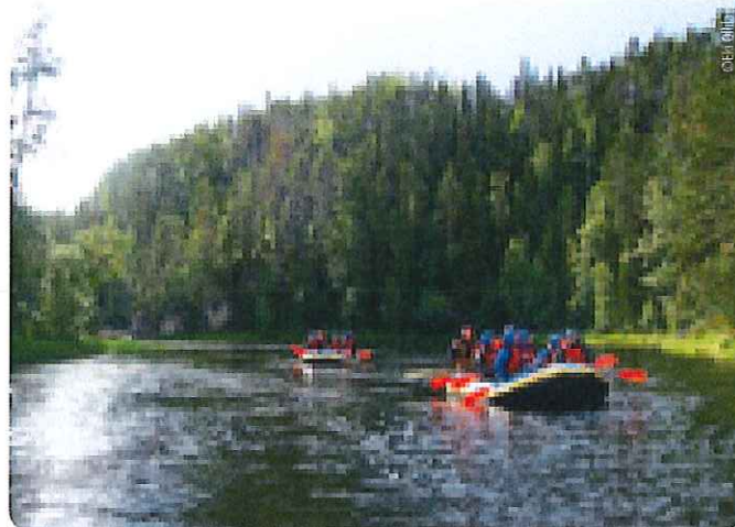
Paddelbootfahrt auf dem Kitka Fluss.

Transfer zum Flughafen Ivalo und Rückflug via Kittilä und Helsinki in die Schweiz.