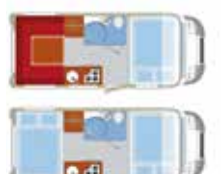
E2 Comfort Cruiser, ca. 7.09 m