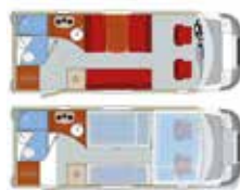
E1 Comfort Star, ca. 6.99 m