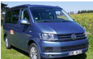
A1 California Star, ca. 4.89 m